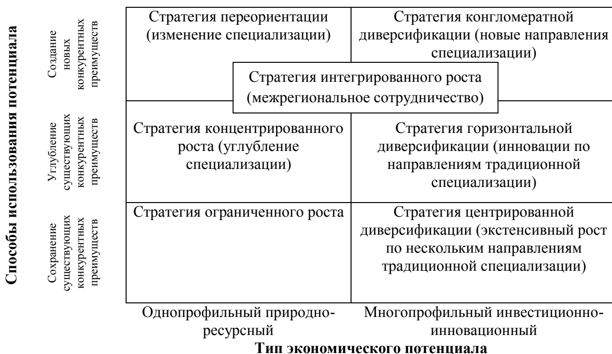
Рисунок 1 - Соотношение типа экономического потенциала региона со способом его использования

экономического потенциала и способы его использования на долгосрочную перспективу (рис.1.).