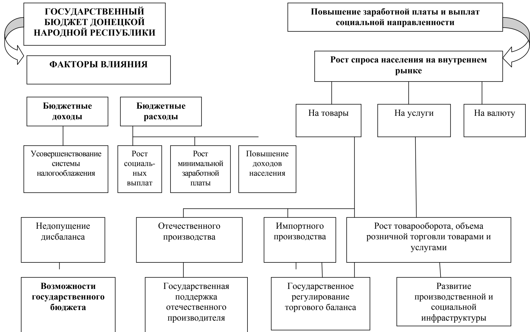
Рисунок 2 - Взаимосвязь государственного бюджета и социально-экономического развития государства