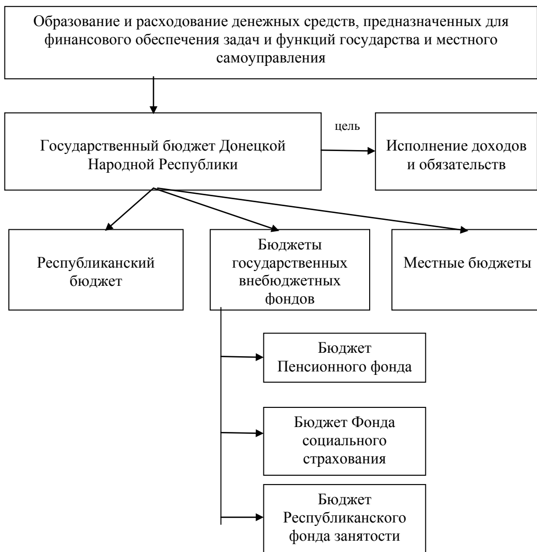
Рисунок 1 - Государственный бюджет Донецкой Народной Республики

Как видно из данных, показанных на рис. 2, государственный бюджет находится под влиянием формирования бюджетных доходов и направлением бюджетных расходов. Основным источником формирования бюджетных доходов служат налоги. В связи с этим, постоянно действующим фактором влияния является процесс усовершенствования системы налогообложения. Думается, что фискальная и регулирующая функции налогов должны работать в полной мере. Это касается, в первую очередь, функций государства, государственного управления распределением и перераспределением финансовых ресурсов. Кроме того, целесообразно разрабатывать налоговую политику государства на перспективу, несмотря на сложные социально-экономические и политические условия. Необходимо представлять и прогнозировать создание финансовых условий для экономического роста повышения благосостояния граждан, внедрения инноваций в производство. Большое значение приобретает соответствие отношений в налоговых потребностях государства и налоговых обязательствах предпринимательства [8].