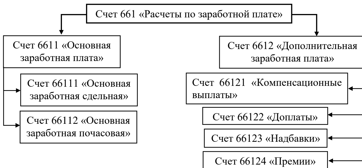
Рисунок 2 – Аналитика 4 и 5 порядка по счетам расчетов по заработной плате.

Предложенные аналитические счета 4 и 5 порядка для счета 66 «Расчеты по заработной плате» могут быть примером для упрощения ведения учета, касающихся оплаты труда. Например, по счетам 4 порядка детализировать информацию о том какие выплаты осуществляются, а счета 5 порядка – для какого работника или структурного подразделения. Необходимость этого заключается в том, что понятие «выплаты работникам» имеет множество направлений.