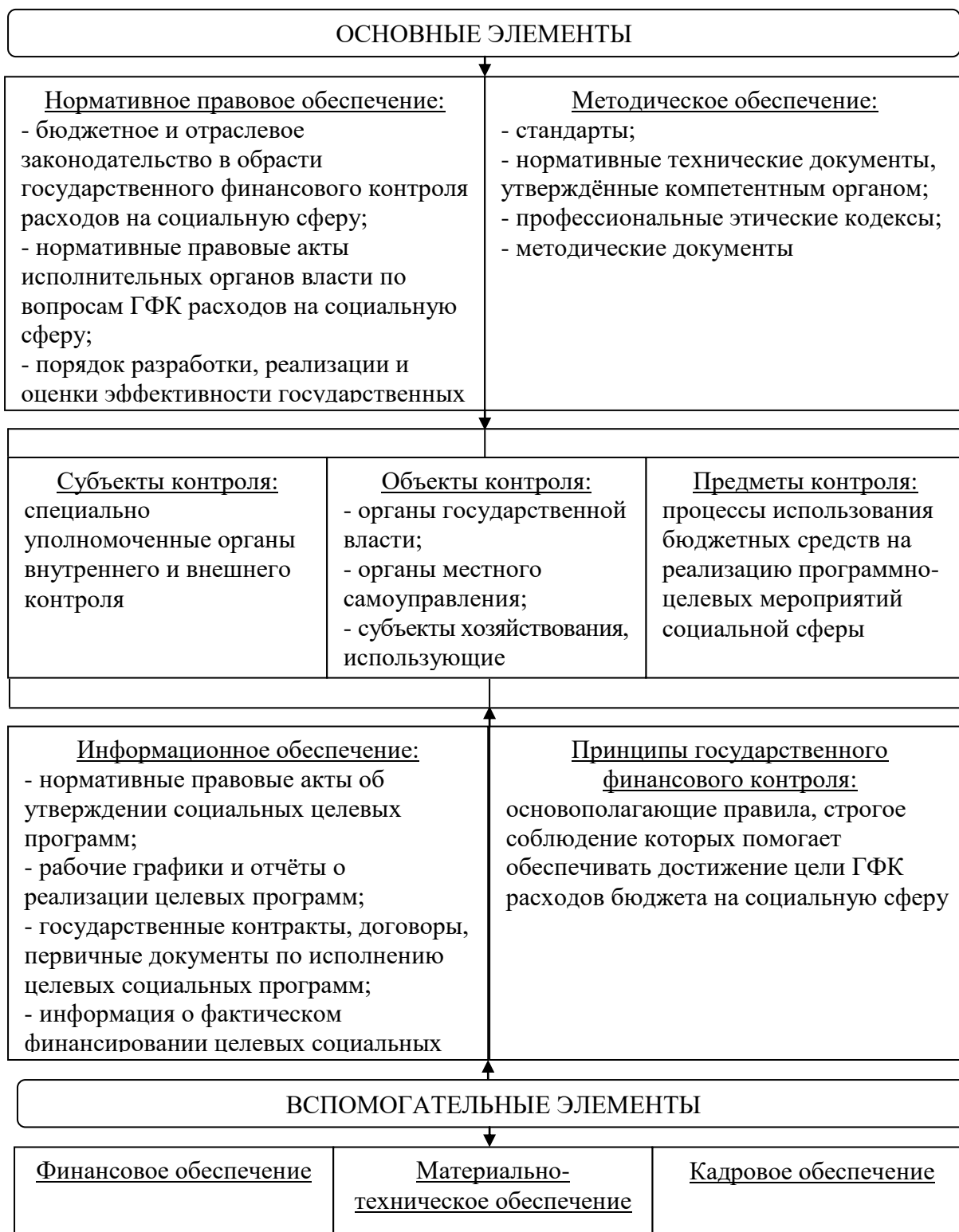
Рисунок 3.- Система государственного финансового контроля расходов бюджета на социальную сферу

В то же время, с точки зрения важности, представленные элементы абсолютно эквивалентны, поскольку проблемы, возникающие в одном из вспомогательных элементов, могут значительно замедлить работу системы контроля.