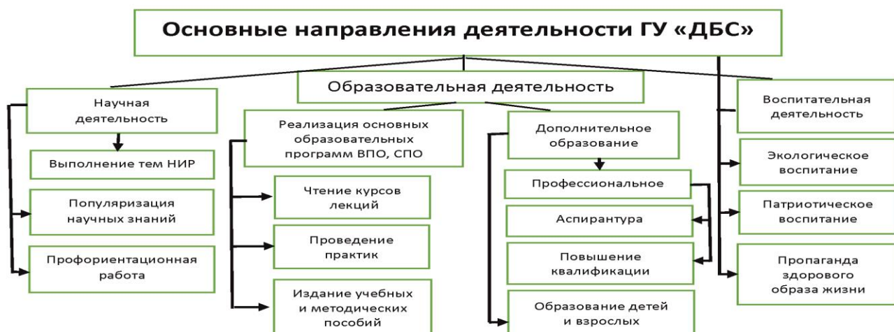
Рисунок 1 – Основные направления деятельности ГУ «Донецкий ботанический сад».

фундаментальных и прикладных задач в области биологии, однако это не исключает многогранности деятельности (рис. 1).