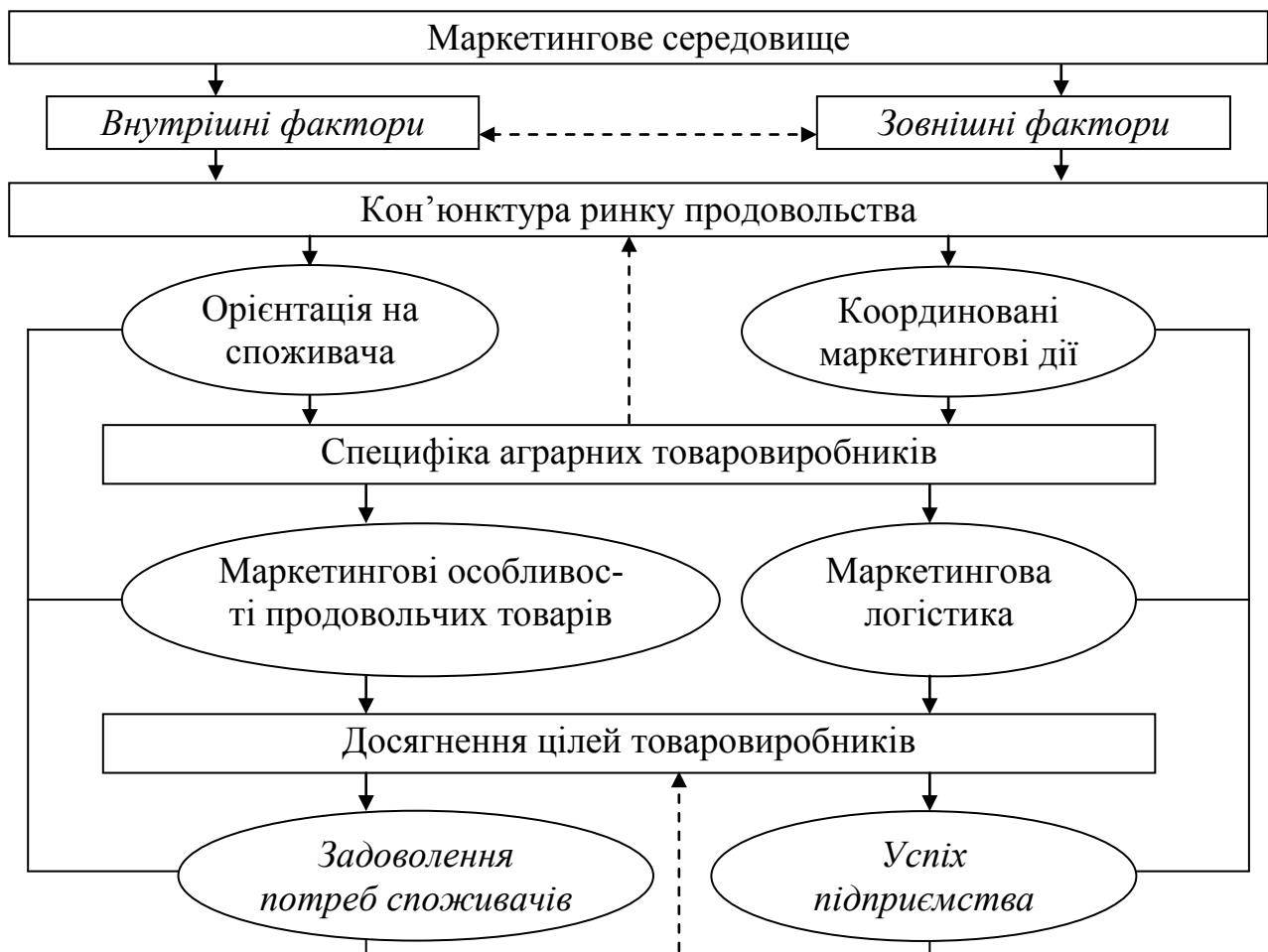
Рисунок 2 – Елементи концепції маркетингової стратегії продовольчого ринку

Уся сукупність агентів маркетингової системи бере участь у процесі виробництва та розподілу й додає свою частку до загальної вартості готового продукту, впливає на характер і силу попиту на первинному ринку, зумовлюючи специфіку сільськогосподарського маркетингу в органічному поєднанні з його метою.