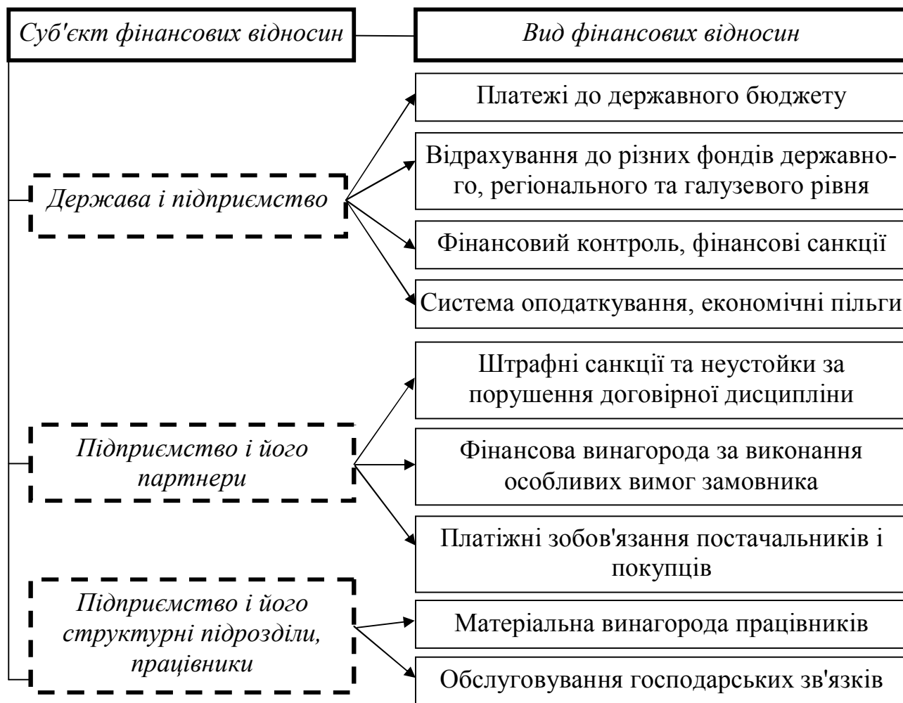
Рисунок 3 – Система фінансових відносин торговельного підприємства

Регулюючи темпи розвитку певних галузей економіки, держава може створювати сприятливий інвестиційний клімат для залучення зовнішніх джерел фінансування, а також ресурсів банківської системи та населення. Сприятливий інвестиційний клімат можна запроваджувати, зокрема, шляхом надання привілеїв в імпорті, створення офшорних зон, технополісів, спеціальних економічних зон тощо.