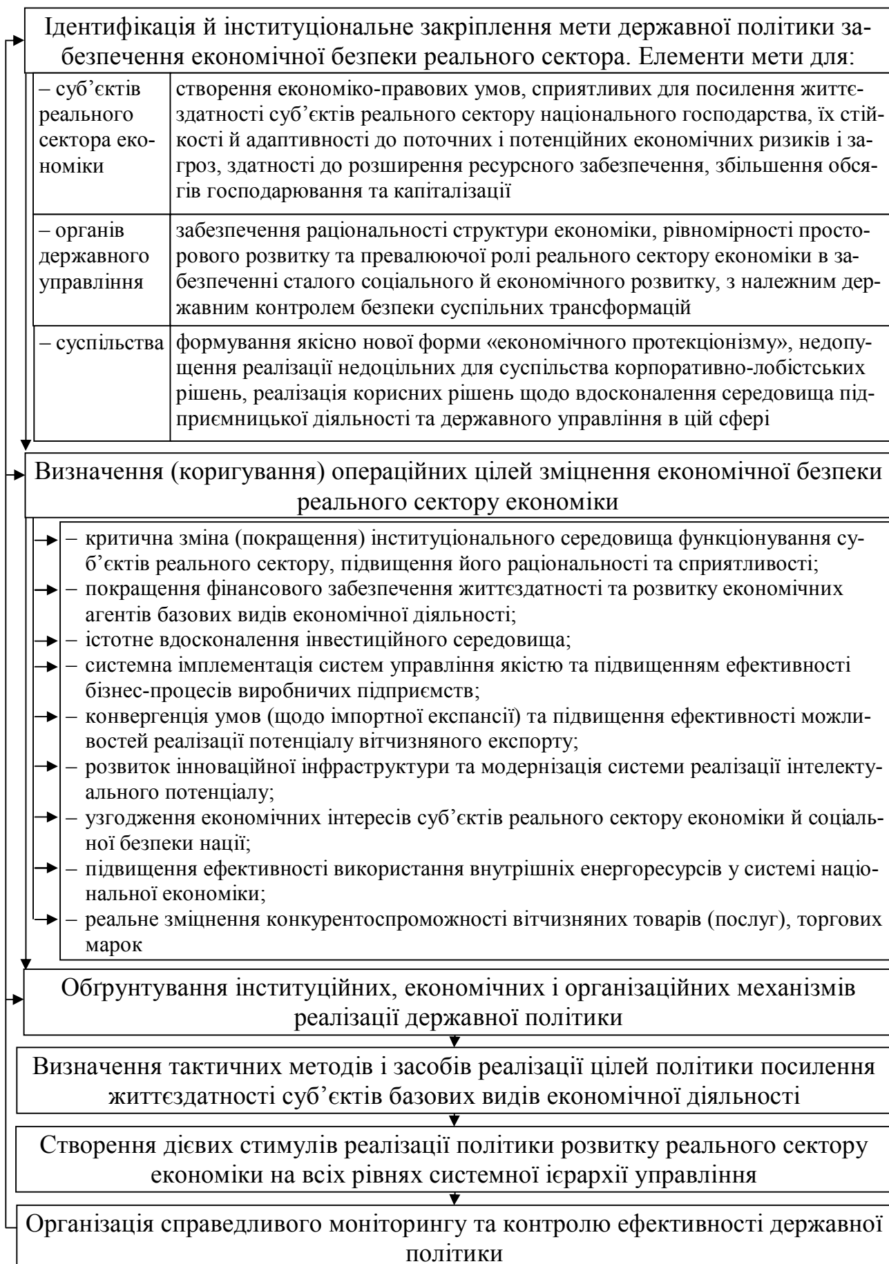
Рисунок 2 – Послідовність імплементації стратегічних пріоритетів державної політики забезпечення економічної безпеки реального сектора економіки України (розроблено автором)