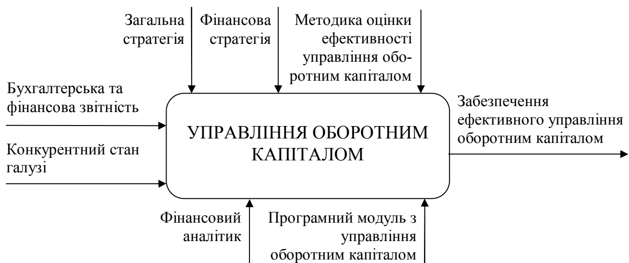
Рисунок 1 – Контекстна діаграма моделі «Управління оборотним капіталом підприємств торгівлі щодо товарів побутового призначення» у стандарті IDEF0

На основі загальних вимог методології функціонального моделювання IDEF0 нами побудовано контекстну діаграму моделі «Управління оборотним капіталом підприємств роздрібної торгівлі щодо товарів побутового призначення», подану на рисунку 1.