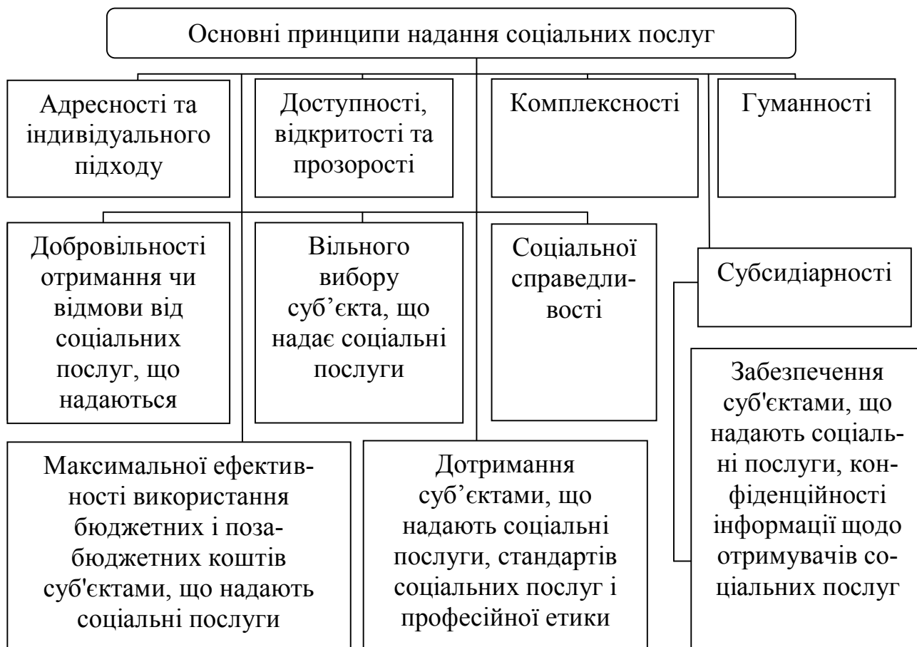
Рисунок 1 – Основні принципи надання соціальних послуг