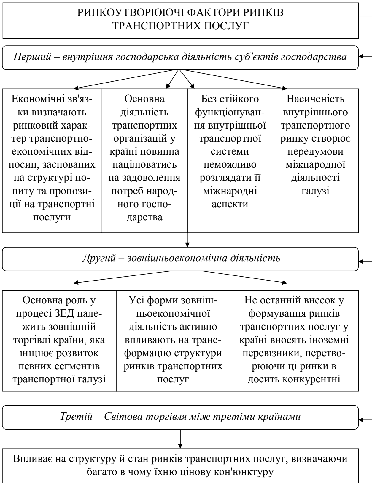
Рисунок 4 – Характеристика ринкоутворюючих факторів ринків транспортних послуг

Перспективами подальших досліджень у цьому напрямку є дослідження структури транспортних послуг, вдосконалення технологій експорту транспортних послуг, що сприятиме набуттю високого комунікаційного статусу системи