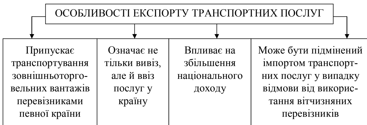
Рисунок 3 – Особливості експорту транспортних послуг

Особливості експорту транспортних послуг для будь-якої країни подано на рисунку 3.