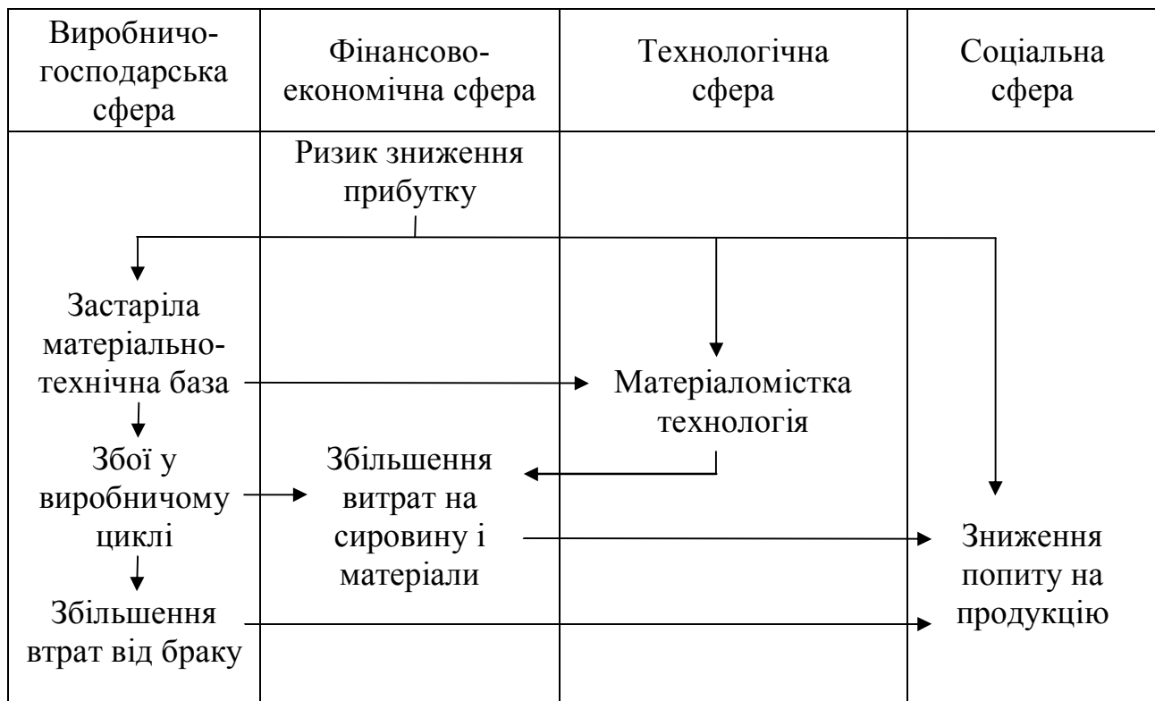
Рисунок 2 – Ризики, що впливають на прибуток КП МТЗ «Сільгосптехніка»

Однак діяльність суб'єкта господарювання, зокрема КП МТЗ «Сільгосптехніка» об'єктивно викликає появу таких видів ризику, які тісно пов'язані з прибутком (рисунок 2).